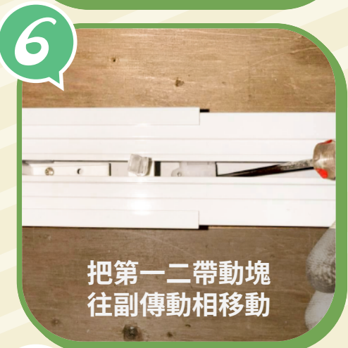
把第一二帶動塊 往副傳動相移動