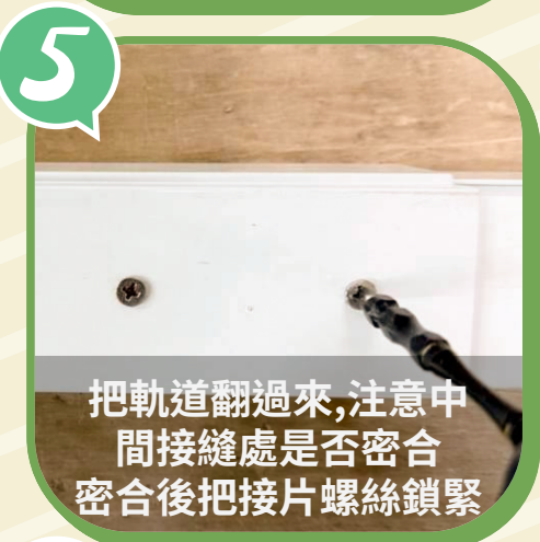
把軌道翻過來,注意中 間接縫處是否密合 密合後把接片螺絲鎖緊