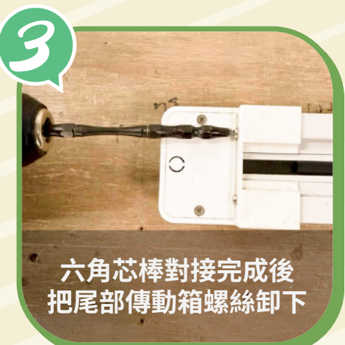
六角芯棒對接完成後 把尾部傳動箱螺絲卸下