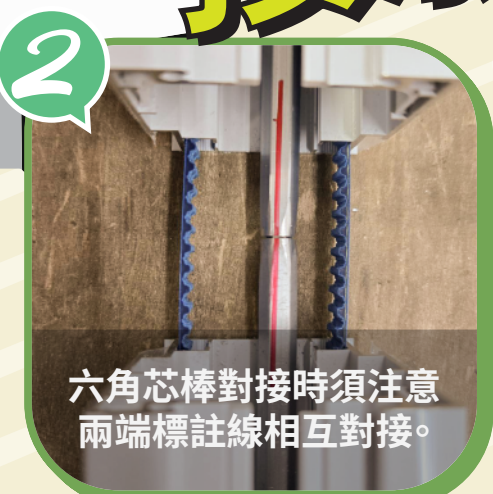
六角芯棒對接時須注意 兩端標註線相互對接。