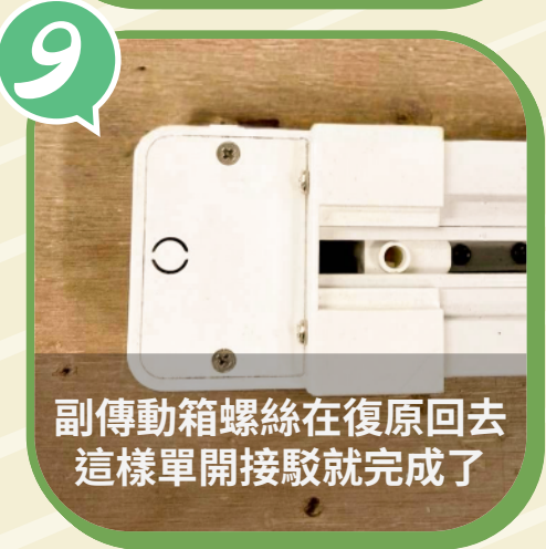
副傳動箱螺絲在復原回去 這樣單開接駁就完成了