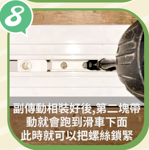
副傳動相裝好後,第二塊帶 動就會跑到滑車下面 此時就可以把螺絲鎖緊