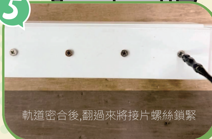
軌道密合後,翻過來將接片螺絲鎖緊