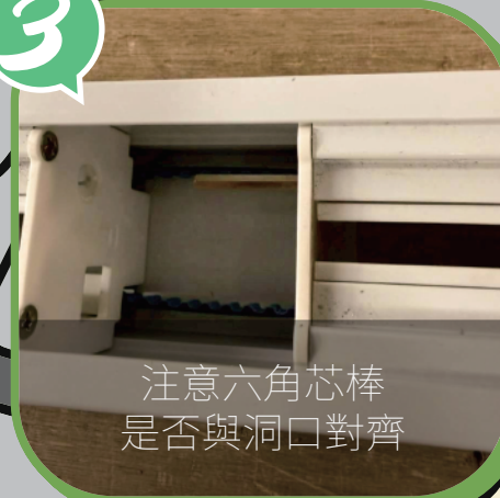
注意六角芯棒 是否與洞口對齊