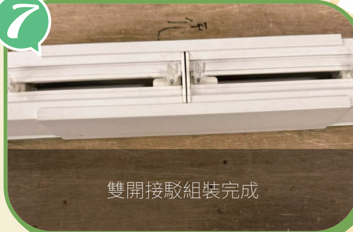
雙開接駁組裝完成